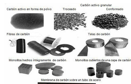
Figura 2. Formas de comercialización del carbón activado.